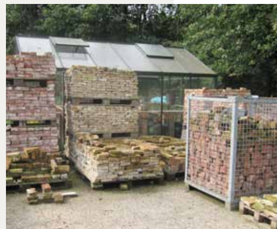
Materiaal op Erve Woldhuis.

Medewerkers van de afdelingen Bouw-, Bosbeheer en de zagerij van Twickel zijn aanwezig om meer te vertellen en te laten zien over het veelzijdige vakwerk op het landgoed. Een smid demonstreert zijn oude ambacht en ook Erve Woldhuis is aanwezig met een stand. Erve Woldhuis verzamelt historische bouwmaterialen voor hergebruik. Twickel heeft de status van Professionele Organisatie voor Monumentenbehoud. Zij krijgen op basis van hun getoonde vakkennis voorrang van het rijk bij het verlenen van subsidies voor monumentenbehoud.