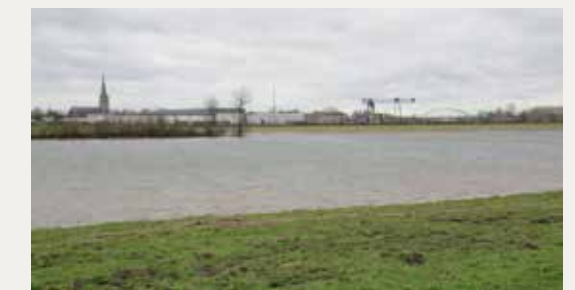
Zicht vanuit de Fraterwaard op het huidige bedrijventerrein.