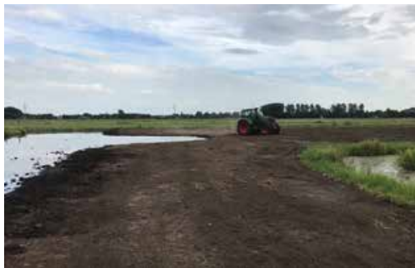
Pachter Ton Westgeest legt de laatste hand aan de plas-dras.

Pachter Ton Westgeest heeft in Wassenaar samen met het waterschap een 'plas-dras' aangelegd. Dit is een gras/water-strook met ondiep water (0-12cm), waar o.a. grutto's, tureluurs, Kieviten en slobenden gebruik van maken. In de afgelopen jaren waren er al twee andere in de polder gerealiseerd. In het voorjaar fungeren ze als verzamelplekken van waaruit de weidevogels hun broedplekje in de regio opzoeken. De vogels kunnen er veilig rusten, poetsen en voedsel zoeken. Tijdens het broedseizoen zijn het belangrijke opgroeigebieden voor o.a. Kievit- en tureluurkuikens. Na afloop van het broedseizoen foerageren jonge en volwassen steltlopers er om zich voor te bereiden op de trek. De aanleg van drassig grasland past in het beleid van Stichting Twickel om samen met pachters een pro-actief weidevogelbeheer te voeren. Dit krijgt ook vorm door bij het maaien rekening te houden met het broedseizoen.