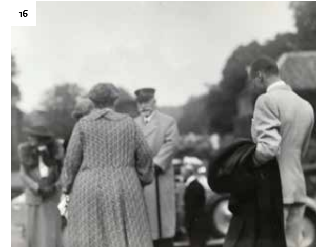
De gevluchte Duitse keizer Wilhelm II bezoekt na de Eerste Wereldoorlog kasteel Twickel.