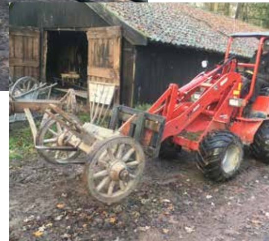
Restanten van de wagens werden vorig jaar in een schuur gevonden.

Boerenwagens waren vroeger belangrijke hulpmiddelen op het erf. Het bezit van vijf verschillende wagens – elk met een eigen functie – was geen uitzondering. Met de komst van de mechanisatie – vooral na de Tweede Wereldoorlog – werden de wagens al snel overtalig en verdwenen ze in de kachel of vergingen ze in een schuur. De wagens werden veelal gemaakt door de plaatselijke wagenmaker en smid. Op Twickel was dat wagenmakerij Van den Barg aan het Bornsevoetpad. Het bouwjaar werd meestal aangebracht op het achterschamel maar ontbreekt helaas op deze twee wagens. Wie over oude wagens spreekt, ontkomt niet aan het jargon, zo blijkt uit een toelichting van Gerard Engbers.