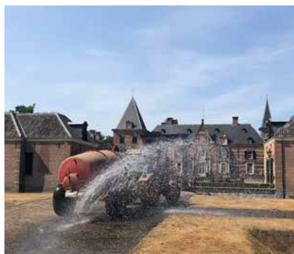
Boven: Hovenier Harm Nijhof houdt de formele tuin nat. Onder: Een tankwagen sproeit water uit de Twickelervaart over het gazon.