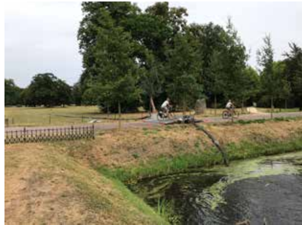
Vanuit de Twickelervaart is water in de gracht gepompt.

In een weiland naast de N346, pal tegenover restaurant Carelshaven, wordt een vijver aangelegd. Met de aanleg, die in het najaar begint, wordt het herstel van het overpark afgerond. De vrijkomende grond wordt gebruikt om de Rondweg fraaier in het landschap in te passen. Plezierige bijkomstigheid is dat de Umfassungsweg wordt verlegd. Een deel van de wandelroute langs de N346 loopt straks langs de nieuwe vijver en gaat met een voetgangersbrug over de Oelerbeek. Om daarna nog een klein stukje langs de N346 verder te gaan.