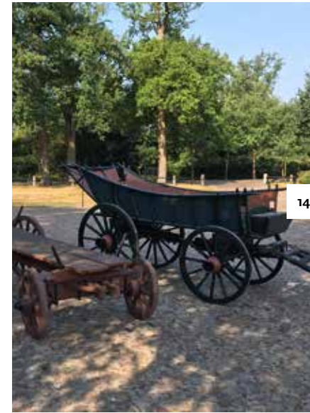
Twee oude houten wagens zijn gerestaureerd en worden op Open Monumentendag tentoongesteld.