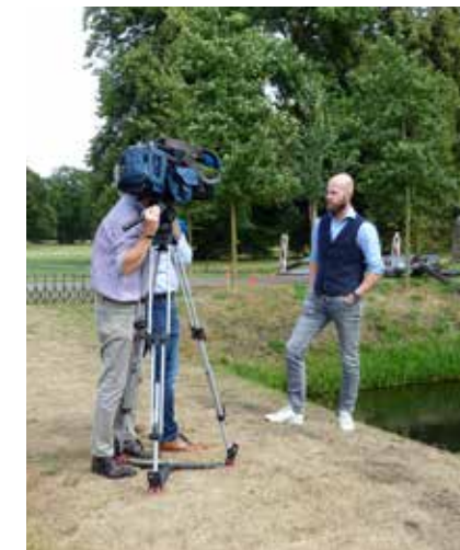
De tijdelijke waterleiding voor de gracht trok de aandacht van de media.

We sluiten de zomer af met de jaarlijkse moestuindag op 9 september. Daar kunt u mijn ‘Hello Fresh Twickel!’ zelf ervaren. Voor jong en oud is er van alles te doen, proeven en zien. Bloemen uit de pluktuin. Fruit, bier, koeienkaas en Twents landvlees proeven. Ook presenteren we ons als Professionele Organisatie Monumentenbehoud (POM). De schilders en timmerlieden van Twickel laten hier zien wat zij kunnen. De bosploeg staat er met ‘Malle Jan’. Als u nu denkt wat is dat....kom vooral kijken!