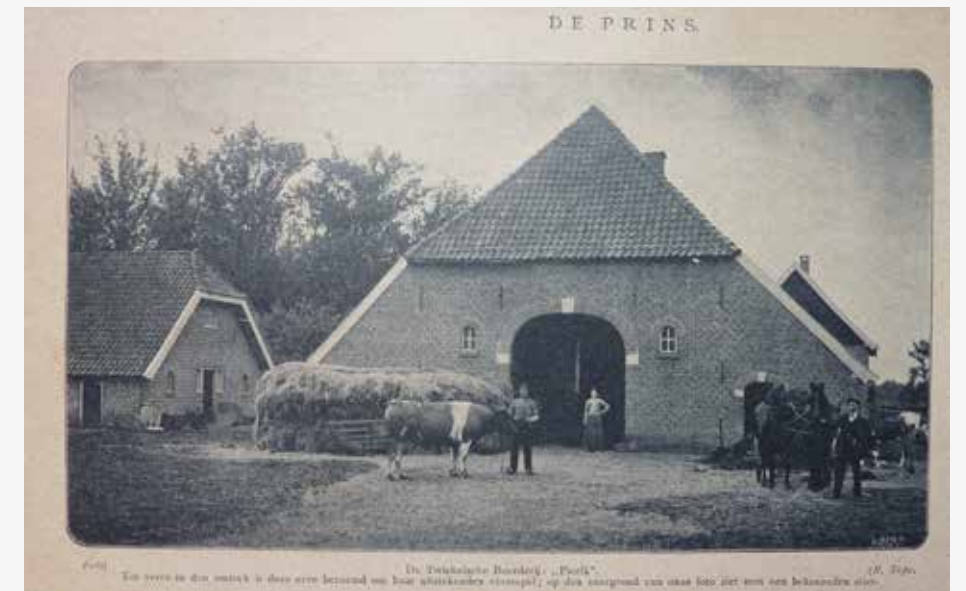
Rechts: De oudste foto die tot nu toe van het erve Pierik bekend is, dateert uit 1907. Natuurfotograaf Richard Tepe maakte de foto in opdracht van het geïllustreerde nieuwsblad ‘De Prins’. Het plaatje staat bij een artikel uit 1907 over ‘Het oude landgoed Twickel. Zijne heerlijke omgeving en zijne historie’. Helaas betreft de historie alleen die van het kasteel. De beschrijving van Pierik beperkt zich tot het onderschrift van de foto.

Berrie denkt dat Erve Pierik over pak ’m beet dertig jaar nog altijd een goed draaiend melkveebedrijf zal zijn, als het even kan zelfvoorzienend. Er moet nu alleen wat krachtvoer bij worden gekocht. Een kleine tien hectare wordt nu verbouwd met maïs. “We denken erover ook sorghum te gaan verbouwen. Dit gewas wortelt beter en dat is interessant met deze periodes van droogte”, zegt Berrie. De blik is niet gericht op groei, maar op het optimaliseren van de bedrijfsvoering. Er wordt hardop nagedacht over vervanging van de kapschuur en een rendabele functie voor twee oude schuren die niet mogen worden afgebroken. “Ze zijn mooi om te zien, maar niet rendabel. Wat kun je hier nog mee”, vraagt Ine zich af. “We merken uit gesprekken dat Twickel als verpachter hierover positief wil meedenken”, zegt Berrie. “Ze zien in dat ze ons pachters nodig hebben om het landgoed levendig te houden.”