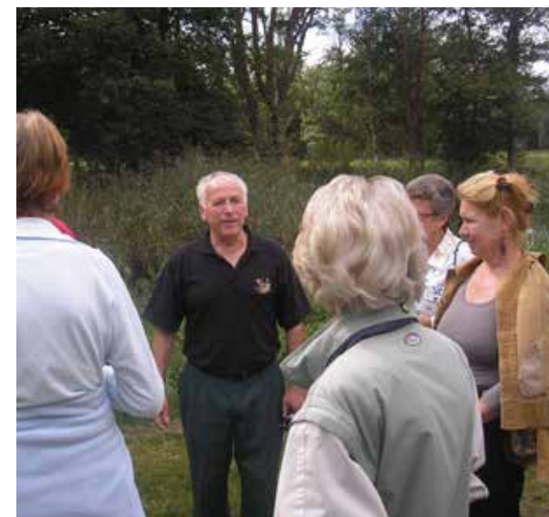
Rondleiding door rustgebied Breeriet.