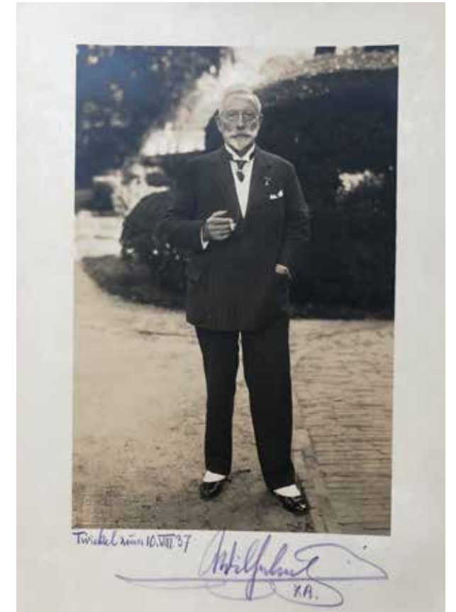
Boven: De inschrijving van de keizer en zijn gemalin Hermine in het oude gastenboek van Twickel. Onder: De portretfoto die de keizer tijdens zijn bezoek aan Twickel uitdeelde.

gastenboek als in het alledaagsche vreemden boek". Er was geen tijd overgebleven om in de tuin te wandelen. Een snelle wandeling was niet mogelijk want de keizer was de laatste jaren zeer verouderd en liep niet graag. De heren van het gevolg namen wel een kijkje in de tuin. Zij bewonderden daar vooral de rozentuin. Bij het vertrek deelde de keizer portretfoto's uit.