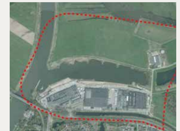
Het oorspronkelijke zoekgebied.

In een gezamenlijke verklaring laten de initiatiefnemers van het bedrijvenpark weten dat na twee jaar voorbereiding gebleken is dat het plan ‘ruimtelijk haalbaar en technisch uitvoerbaar’ is, maar ‘financieel niet betaalbaar’. Ook het tijdsaspect speelde een rol. Rekening houdend met alle procedures en de technische eisen die aan de uitbreiding zijn verbonden zou het nieuwe terrein op zijn vroegst in 2024 klaar zijn, terwijl met name Rotra op korte termijn wil uitbreiden. De bedrijven zoeken nu elders in de regio naar uitbreiding. De initiatiefnemers van Logistiek Ecopark IJsselvallei willen blijven samenwerken.