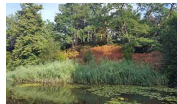
Boven: In de moestuin hebben veel planten het moeilijk zoals Veronica (ereprijs), Cimicifuga (zilverkaars) en Phlox paniculata (vlambloem). Onder: De rododendrons op het Bergje worden als verloren beschouwd.