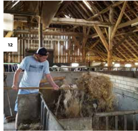
Op Erve Pierik is de jongste generatie optimistisch over de toekomst van het melkveebedrijf.