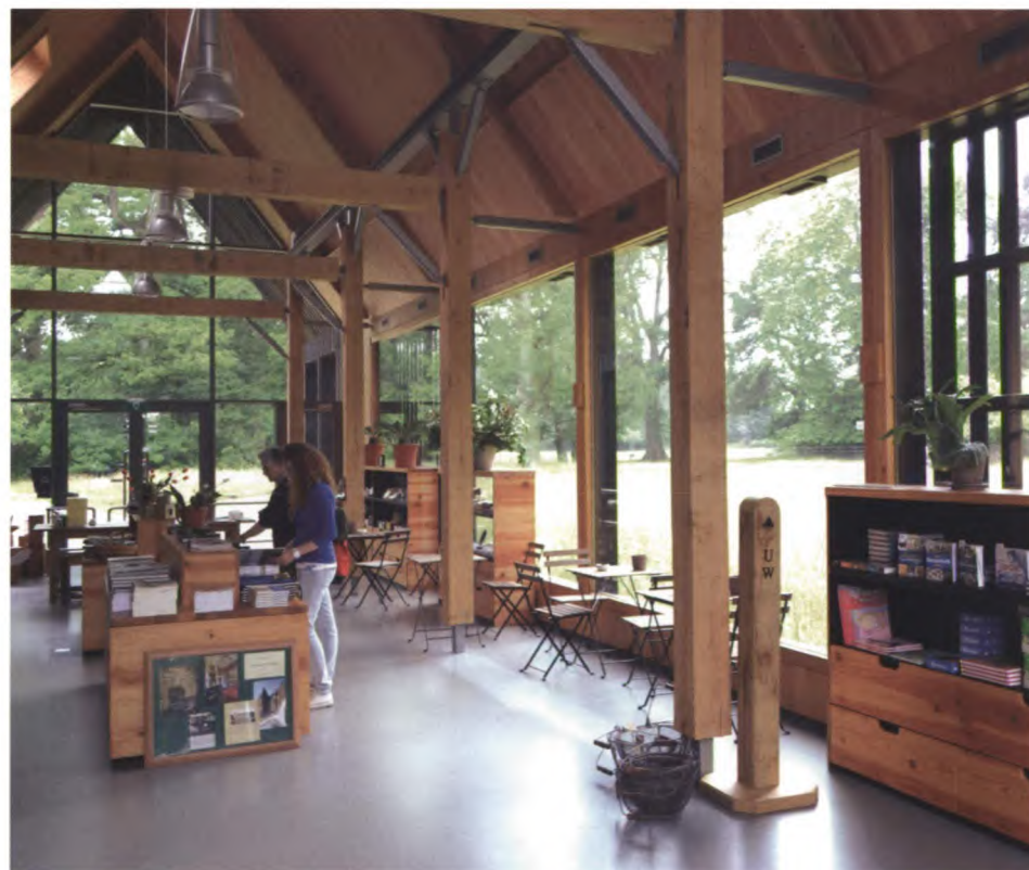
Door een andere indeling is er meer ruimte gecreëerd.

Gelijk met de komst van de zitjes is de indeling van de landgoedwinkel aangepast. Kasten zijn verplaatst of weggehaald, zodat de benodigde ruimte is gecreëerd. Hierdoor hebben we wel onze collectie iets moeten aanpassen. We bieden nu minder boeken aan, maar nog steeds hebben we een heel divers assortiment. Bezoekers uit de omgeving komen veelal voor de landgoedproducten, zoals de geitenkaas of de jams uit eigen keuken. Bezoekers van bijvoorbeeld de Kasteeldagen zijn weer meer geïnteresseerd in boeken over de historie of producten als koperpoets, als ze alles in de keuken hebben zien blinken.” Zodra de landgoedwinkel is voorzien van een ipad, zodat bezoekers ook op die manier zelf informatie over Twickel kunnen vergaren, is de vernieuwing compleet.