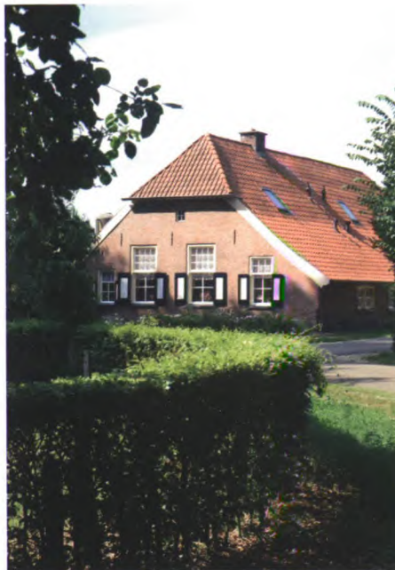
Erve Groot Peddemors in Enterbroek.