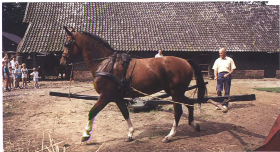
Demonstratie van de geubel tijdens de OLM-manifestatie in 1987.