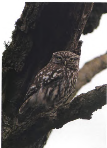
Oude hoogstamboomgaarden vormen een ideaal biotoop voor de steenuil.