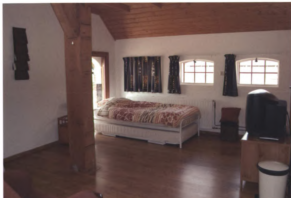
Gastenkamer in de Bed&Breakfast.

“Het werk op de boerderij is de kapstok waar de zorgverlening aan is opgehangen. Het draait om aandacht voor de cliënten en hun werkervaring. Iedereen kan hier werken op zijn of haar niveau en tempo. De een heeft meer ondersteuning nodig dan de ander, maar de nabijheid van begeleiding is voor iedereen belangrijk. Er is een klein team van medewerkers en stagiaires die hierbij ondersteunt. Maar er moet wel gewerkt worden op de boerderij. Aan het eind van de dag mag iedereen wel een beetje vies of moe zijn.”