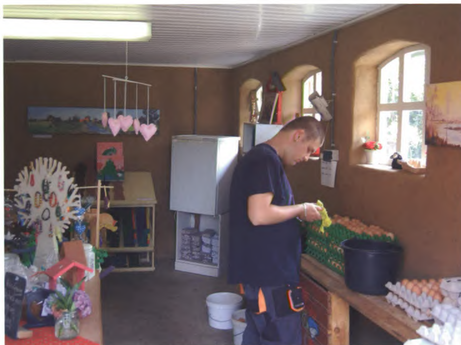
Aan het werk in de zorgboerderij.

“Erve Groot Buren valt onder stichting Philadelphia, die mensen met een verstandelijke beperking begeleidt en ondersteunt. De boerderij is als dagbesteding