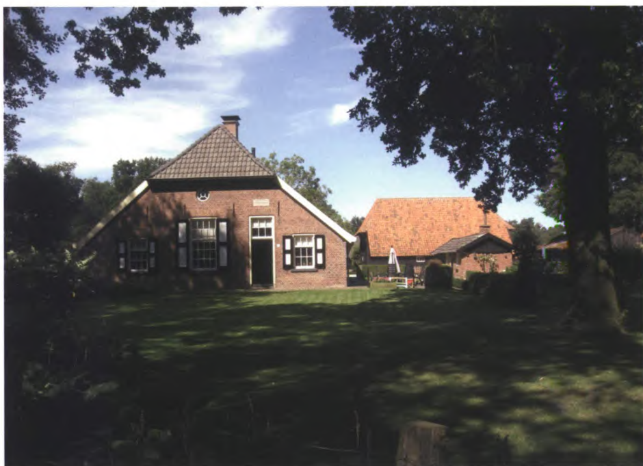
Traditionele Twickelboerderij met wolfseind.

De zorg voor een fraai landschap en verzorgde boerenerven zit bij Twickel in de genen. Al in de 18 e eeuw verordonneerde de toenmalige eigenaar van Twickel, Unico Wilhelm van Wassenaer, dat “De huysen die vertimmert moeten worden, sullen voortaan geen planken gevels, voor nog agter mogen hebben, maar met afvallend stroodak off zogenaamde wolfskappen gemaakt worden”.