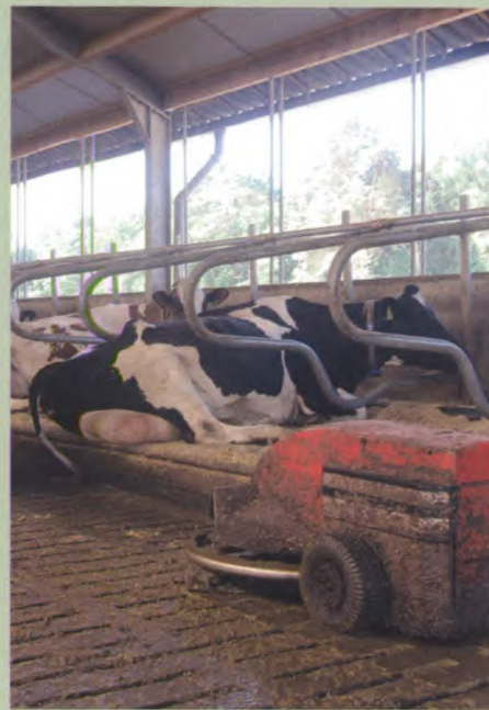
De mestrobot neemt de boer werk uit handen.