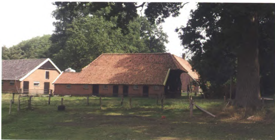
Boerenerven met houtopstanden en oude schuren herbergen meestal veel broedvogels.

een grote nestkast in het erfbos worden opgehangen; voor de kerkuil en steenuil zijn speciale nestkasten nodig die bijvoorbeeld in de kapschuur gezet kunnen worden. Er zijn altijd wel leden van lokale werkgroepen bereid de kasten te maken en op te hangen (en later te controleren en schoon te maken). Er zijn zelfs speciale kerkuil- en steenuilbrigades. Ook vestigt zich tegenwoordig graag een paartje van de holenduif in deze grote nestkasten. De holenduif was vroeger een zeldzame broedvogel in hollen van de zwarte specht in oude eenzame bossen. Als de boerenerven rijk zijn aan oud loofhout vertonen zich (naast houtduiven, eksters en gaaien) soms spechten: de grote bonte specht, de veel zeldzamere kleine bonte specht (slechts musgroot!) en hier en daar ook de groene specht. Wordt er 's winters bijge-