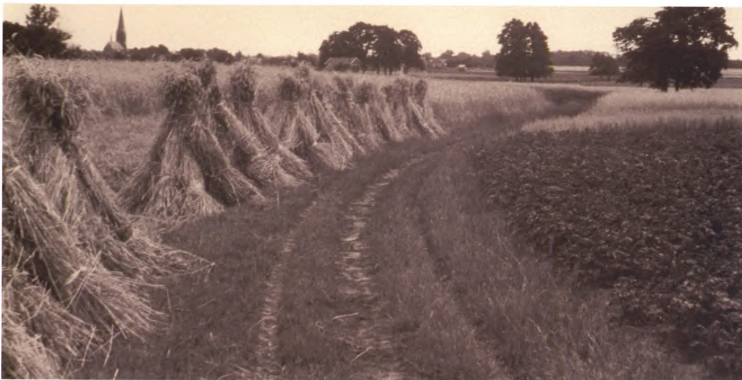
Roggeschoven op de Deldeneresch.