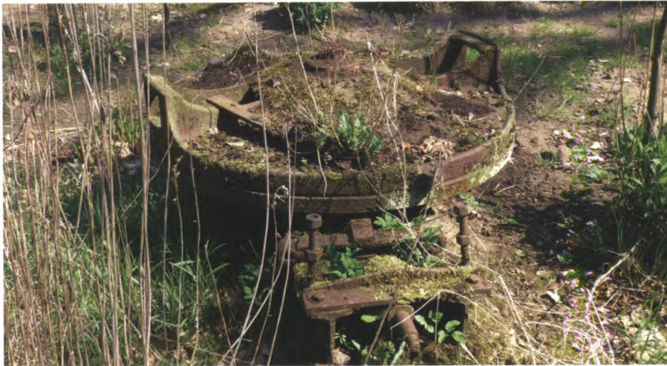
Restant van de geubel bij Erve Voortman.

Door de mechanisatie zijn veel oude handgereedschappen en werktuigen uit het boerenbedrijf verdwenen. Op een enkel boerenerv in Twickel zijn ze nog te zien.