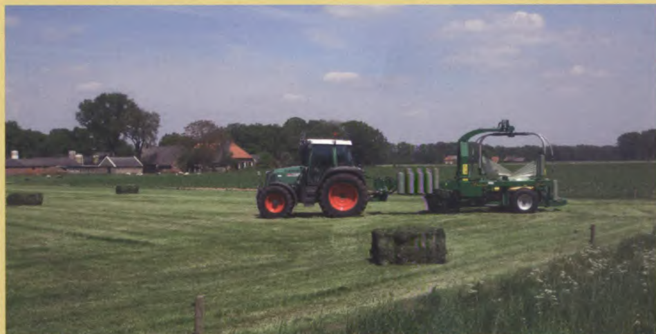
De landbouw op Twickel moderniseert. Een machine pakt grasballen in.

Door de import van veevoer groeide de pluimvee- en varkenstak van veel agrarische bedrijven in de 20ste eeuw flink. Een enkel bedrijf specialiseerde zich hierin. In de jaren zeventig deed de ligboxenstal geleidelijk zijn intrede op Twickel. Hierdoor ontstonden forse mestoverschotten. Stichting Twickel maakte zich hier zorgen over, net als over het verkeer dat de uitdijende agrarische bedrijven aantrokken en de gevolgen voor de natuur. Om het evenwicht tussen het areaal landbouwgrond en de omvang van de veestapel te herstellen richtte het beleid zich op bevordering van de grondgebonden agrarische takken. In de praktijk verdwenen de