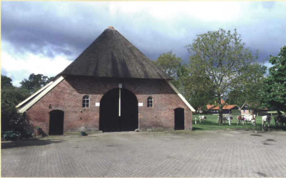
Erve Groot Hobbelink.