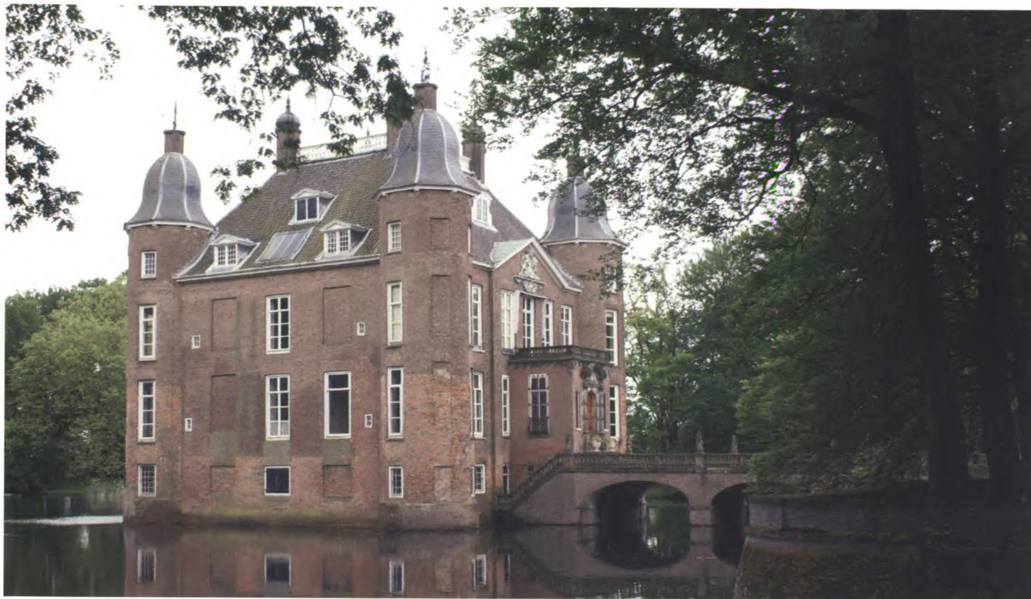
Kasteel Biljoen in Velp, rijksmonument en Beschermd Buitenplaats.

agenda van de rijksoverheid blijft staan want de instandhouding van buitenplaatsen is volgens hem een zaak van “landelijk belang”. “Het zijn allemaal huizen van enkele honderden jaren oud. Dit cultureel erfgoed moet ons wat waard zijn en dat kun je niet overlaten aan de diverse eigenaren.” De afgelopen jaren hebben eigenaren het lastig gekregen door het wegvallen van rijkssubsidie voor particuliere historische buitenplaatsen en andere bezuinigingsmaatregelen. Dessing: “Er moet iets gebeuren want het groenonderhoud op de buitenplaatsen is niet meer te betalen. Dan kun je stellen; verkoop het maar aan een nieuwe eigenaar, maar ik weet niet of dat de oplossing is.” De beschermde status van veel monumenten werkt hoge beheerskosten in de hand. Als voorbeeld noemt Dessing het aanbrengen van dubbele beglazing; veel eigenaren kunnen hiermee de energiekosten terugdringen maar het staat op gespannen voet met de regelgeving voor monumenten. In een poging om toch meer inkomsten te vergaren, gaan eigenaren ertoe over hun buitenplaatsen (deels) een culturele-, recreatieve-, of horeca-invulling te geven. Dessing juicht een ondernemender houding toe maar waagt zich niet aan een