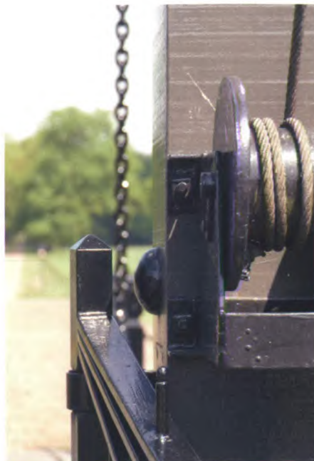
Ophaalbrug bij kasteel.