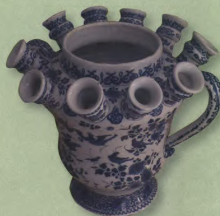
De tulpenvaas in kasteel Twickel.

rode terracotta klei. Wel of geen tuitjes, dat was de vraag. Het zijn gaten geworden, verwerkt in het deksel en bekroond met een eikel, een vorm die ook de bleekpotten van Twickel siert. De vaas is vanzelfsprekend aan de binnenkant voorzien van een waterdichte glazuurlaag. Het is een aardse en moderne versie geworden van een wereldberoemd ontwerp en daarmee zetten we een traditie voort." De 'bloemen-