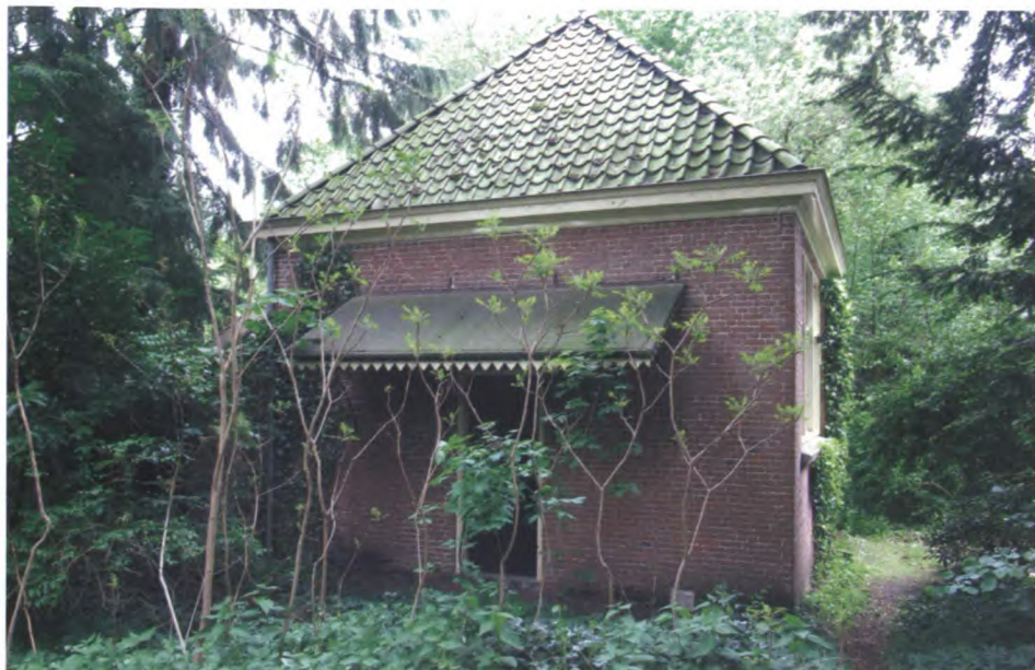
Atelier aan de Zaagmolenweg.