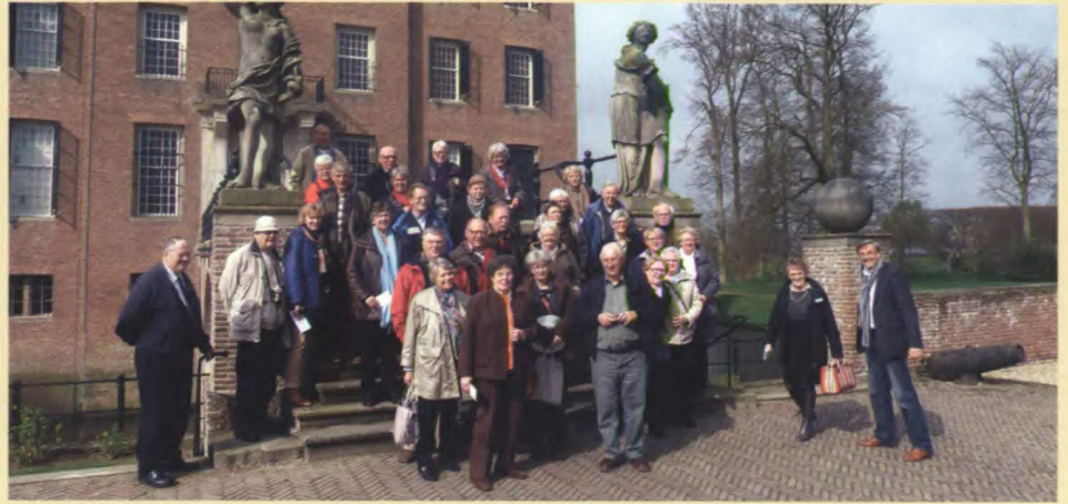
Vrienden voor de boogbrug van kasteel Amerongen.

Bovenstaande regels uit het volkslied van Amerongen waren zeer toepasselijk tijdens de vriendendagen. Kasteel Amerongen weerspiegelde onder een stralende zon in de slotgracht terwijl een ooievaarspaar op één van de vier schoorstenen een nest maakte. Na de koffie met ‘Margaretha’s appelgebak’ in de smaakvol ingerichte stallen werden we in twee groepen verdeeld.