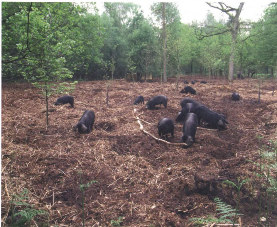
In het Altena's bos lopen 17 varkens.

Rustig wandelend loop ik over het Altenavoetpad het Altena's bos in. Ik luister goed of ik ze misschien hoor. Het blijft rustig. Ze zijn er toch wel? Ik loop wat verder en zie wel beweging, en inderdaad hoor ik wat zacht geknor.