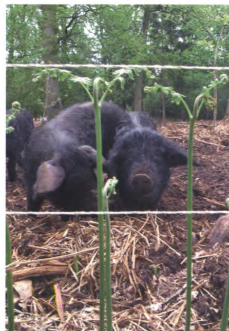
Varens en varkens worden gescheiden door een afrastering.

Roy Schuurman, beheerder bossen Twickel -Zuid, Lage en Brecklenkamp