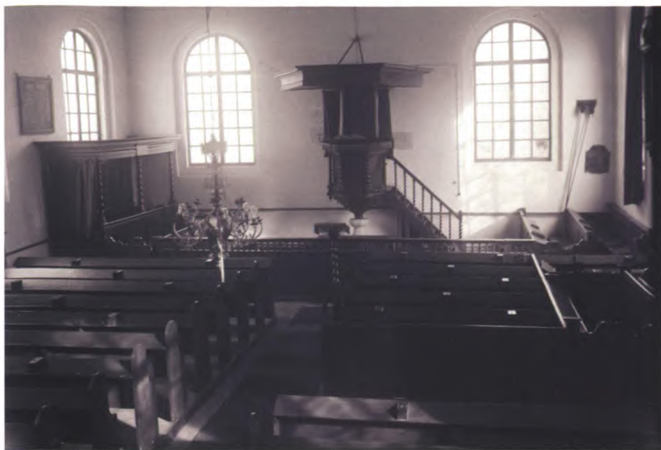
Interieur met rechts de herenbank in 1953.