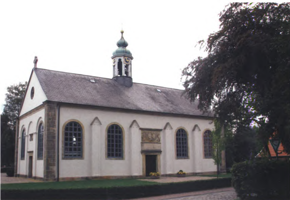
De kerk in Lage.