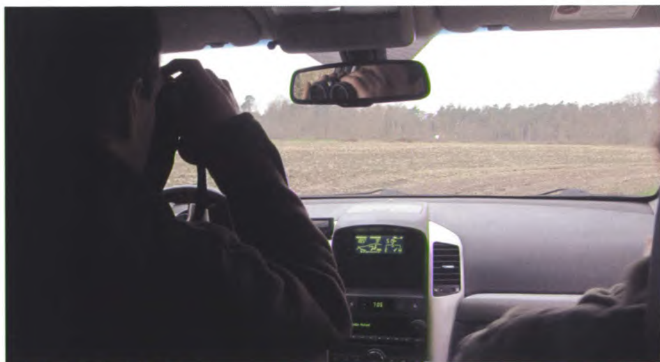
Turen over het open veld.