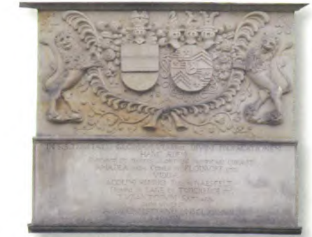
Inscriptie met de wapens van het echtpaar Van Raesfelt en Van Flodroff.

Na Amadea beleefde de kerk verschillende renovaties. In 1855/56 kreeg ze een nieuw en vlakker dak met een nieuwe dakruiter. Het oude uurwerk uit 1688 werd gerestaureerd en de kansel verzet; een nieuw orgel en nieuwe kerkbanken deden hun intrede. Bij de restauratie in 1977 moest de oude