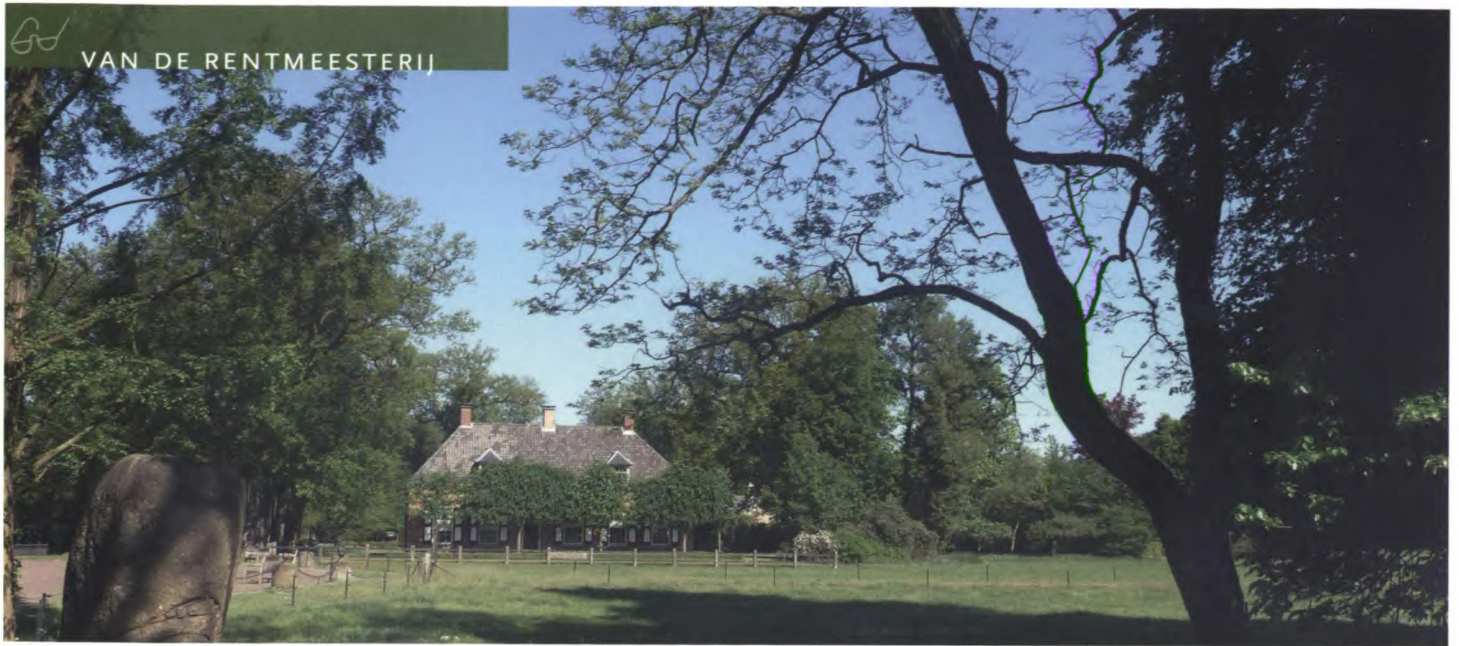
VAN DE RENTMEESTERIJ