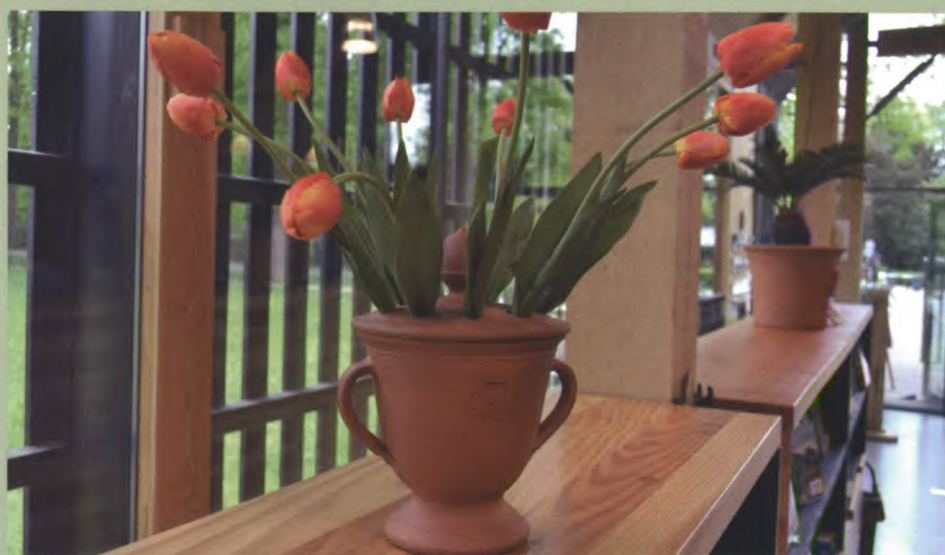
De tulpenvaas in de landgoedwinkel.