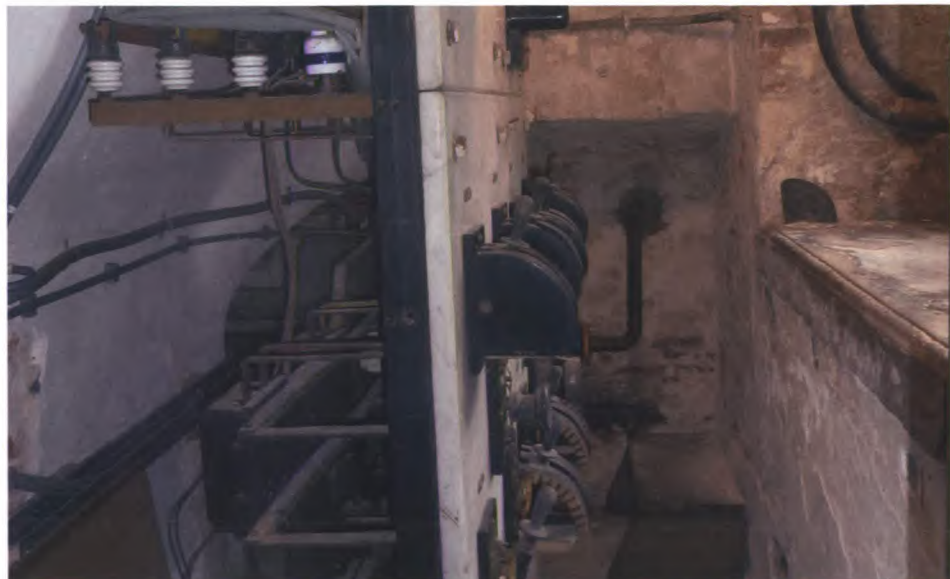
Hoofdschakelbord uit 1912 in het onderhuis.