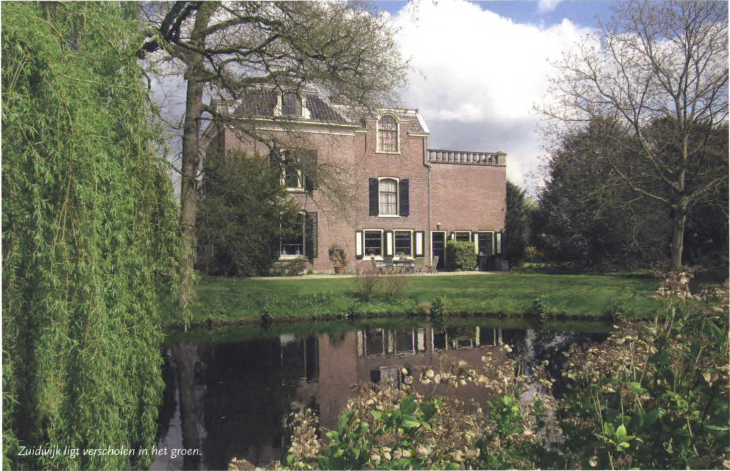
Zuidwijk ligt verscholen in het groen.