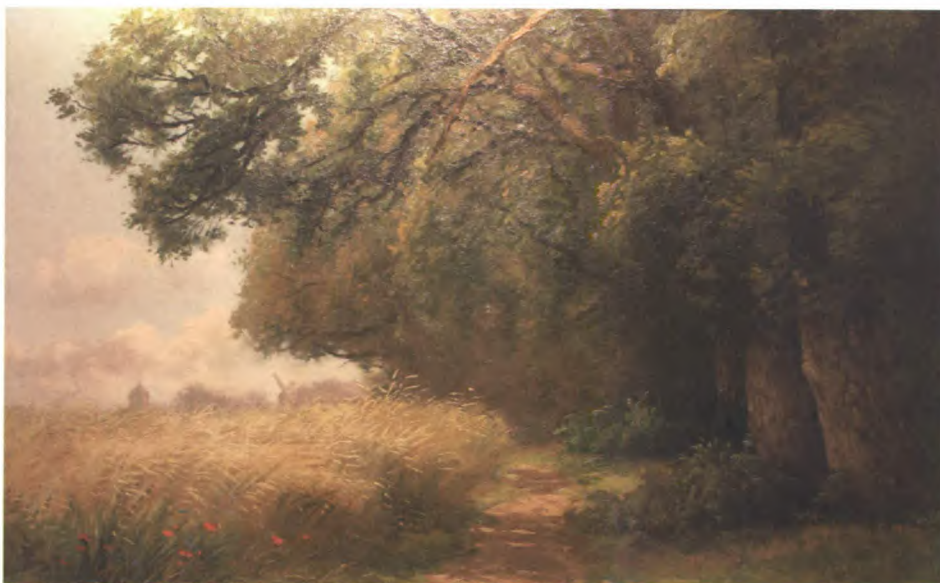
Schilderij van de Deldeneresch.