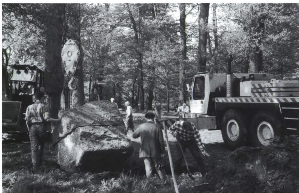
Andere paardekracht dan die in 1845.