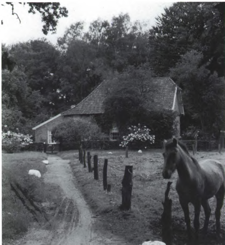
Jong leven bij het Meesterhuis in Azelo. Foto: A.C. Meyling, ca. 1960.