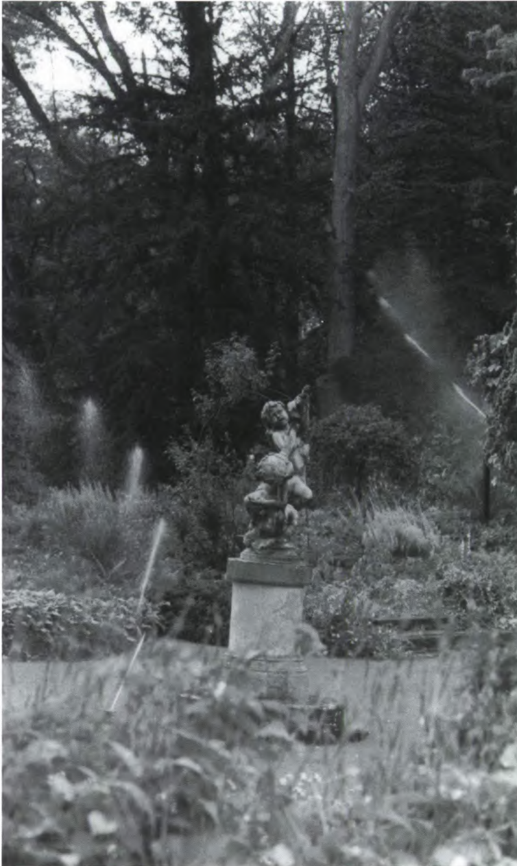
Waterballet in de Rotstuin.

De Stichting Twickel stelt al enkele jaren kerstpakketten samen; deze zijn bestemd voor personeel, oud personeel en vrijwilligers die actief zijn in en rond het kasteel. in