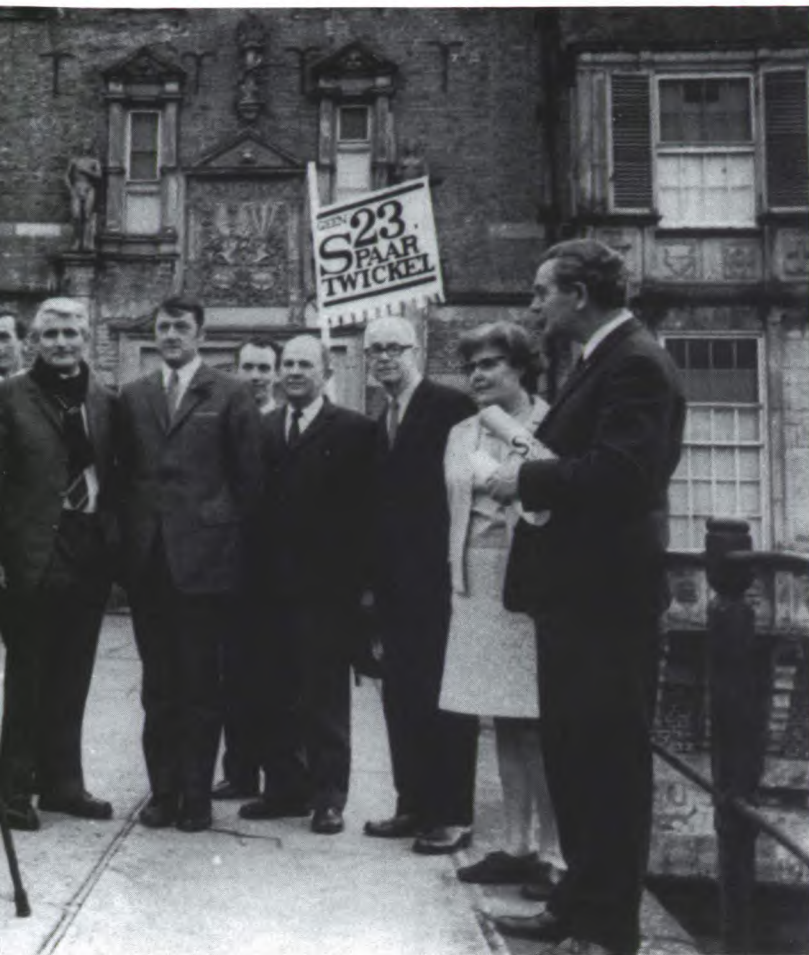
van dit artikel verschuilt zich achter de barones. Foto: collectie huisarchieftwickel, 1972.

zitting een experiment: het was de eerste keer dat men zo iets deed. De stroom reacties die daarna op gang kwam, is het best te typeren als een verlate inspraakprocedure. Met dit verschil dat de spelregels die later bij inspraakprocedures golden, toen nog niet bestonden, zodat de provincie niet goed wist hoe de volkswoede gekanaliseerd moest worden. De hele openbare meningsvorming en later ook de besluitvorming over de S23 kregen daardoor een geïmprovisiseerd en nogal chaotisch karakter.