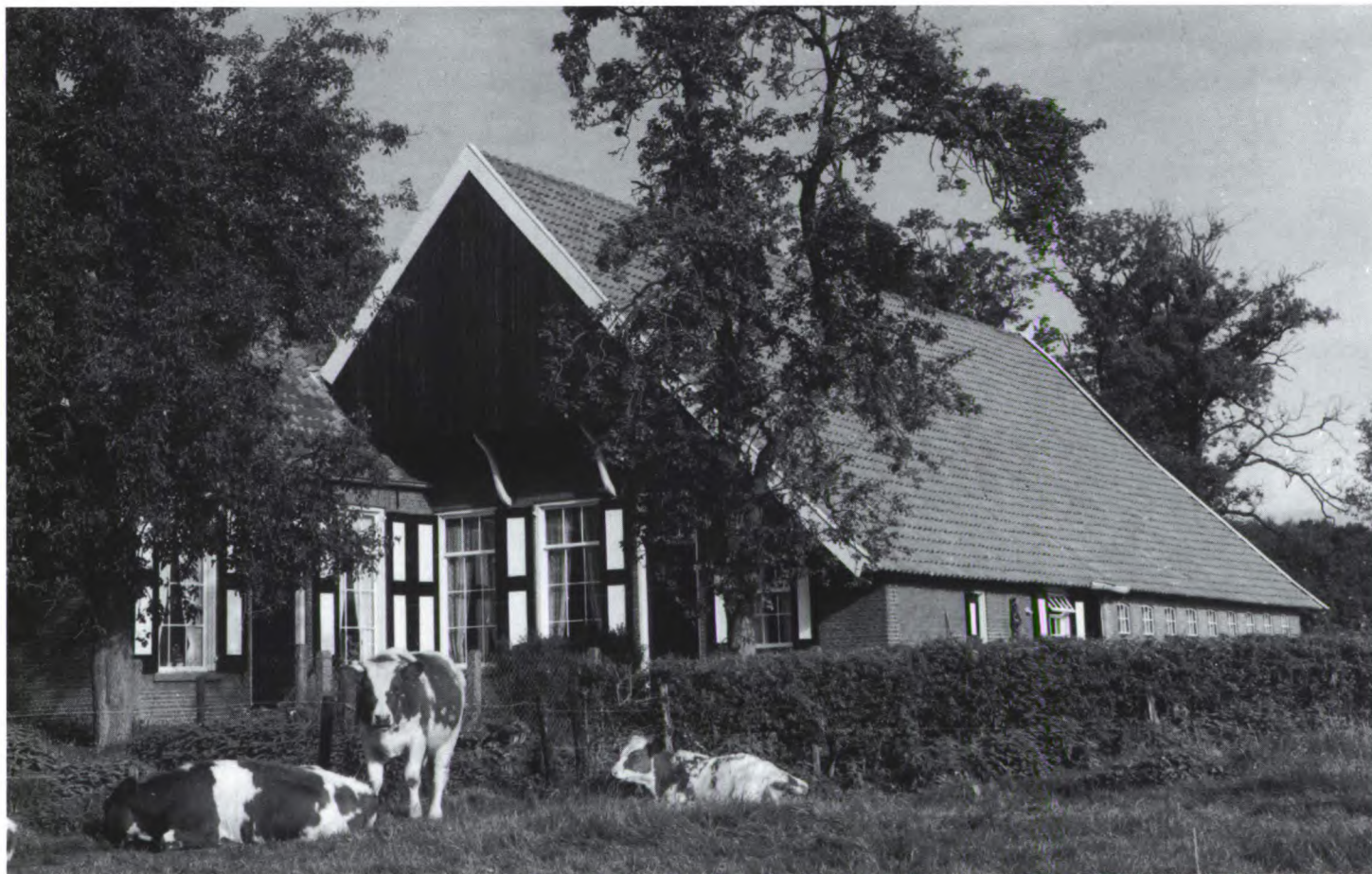
Erve de Vörger in Oele. Foto: A.C. Meyling, ca. 1960.

Minister van Landbouw, Natuurbeheer en Visserij