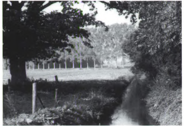
De Woolderbeek.

Dit is een treffende beschrijving van de zogenaamde Salami politiek. Men moet zich hierbij realiseren dat dit plan zich slechts richt op het jaar 2010. Als we in dit tempo doorgaan, staan we in de tweede helft van de volgende