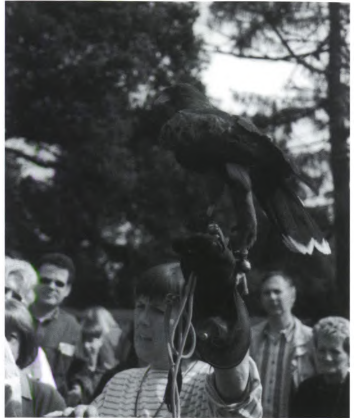
De jubileumdagen 650 jaar Twickel trokken een groot aantal belangstellenden. Vooral de eerste op dag op 25 mei was een enorme publiekstrekker. De tuinen van Twickel trokken 1900 bezoekers. In de houtzaagmolen, de bossen en bij de demonstraties met roofvogels was de belangstelling nog veel groter. Ook de agrarische dag was een groot succes. De open dag in Dieren ondervond veel hinder van het slechte weer. Dit was jammer, vooral omdat de organisatoren zich enorm hadden ingezet en -er tot vreugde van vele kinderen- niet voor terug deinsden een theatergroep in te schakelen.