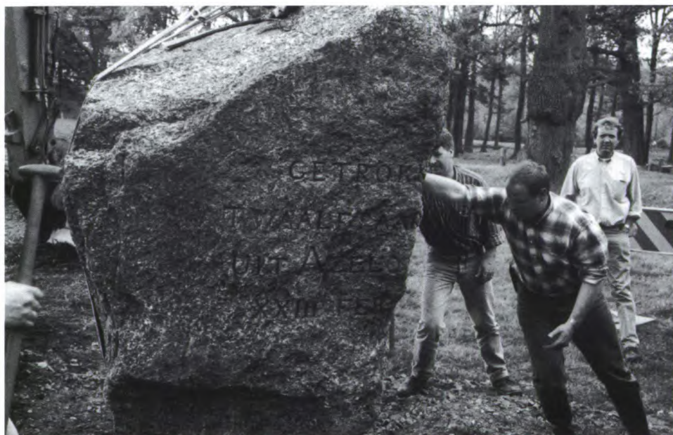
Andere paardekracht dan die in 1845.