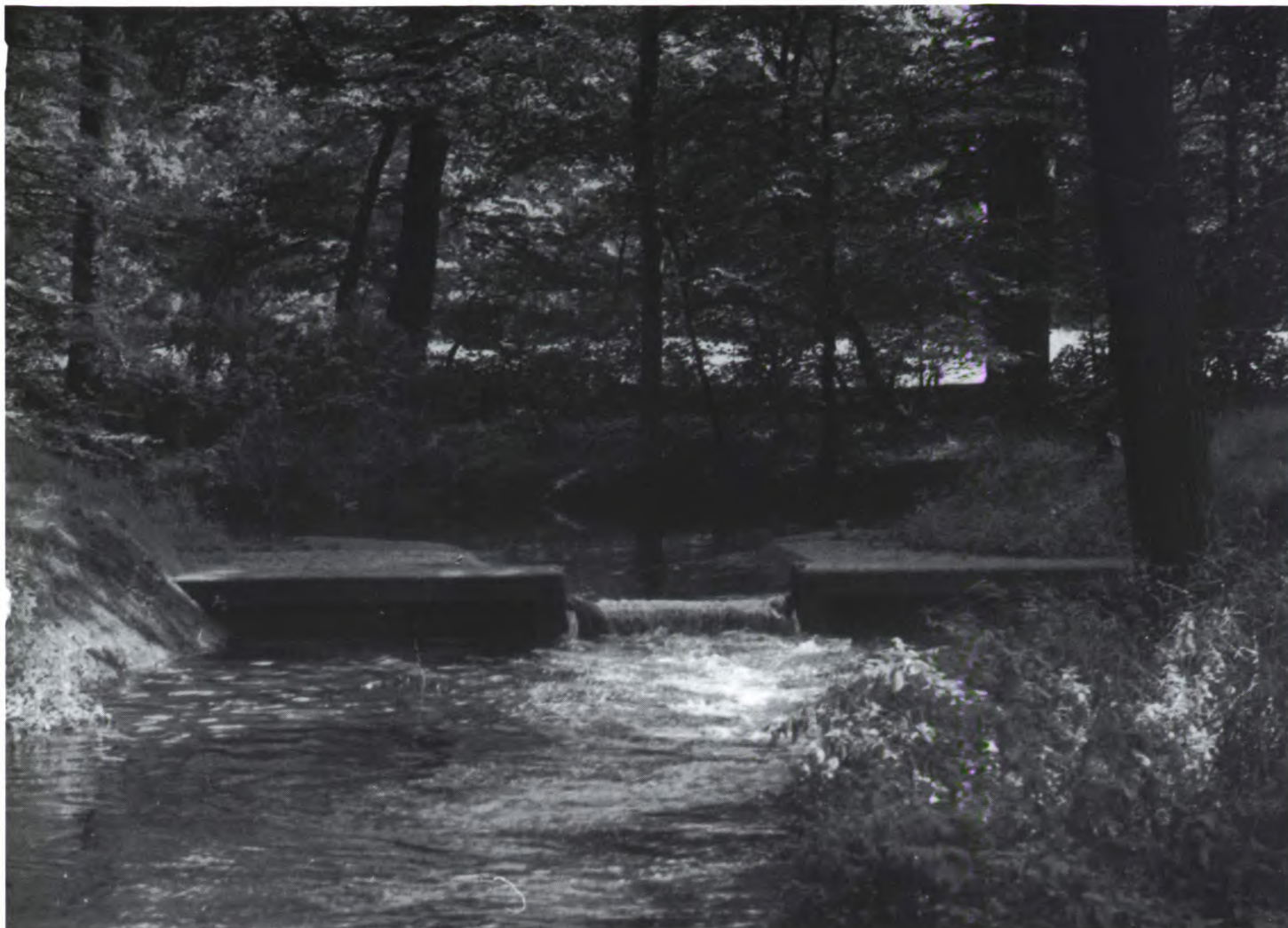
De overlaat van de Oelerbeek naar de Twickelervaart. ca. 1960.

Neem de boswet. Daarvan ligt de uitvoering primair bij de provincie, maar ook gemeente-ambtenaren zijn erbij betrokken. Kleinere gemeenten met weinig ambtenaren in dienst hebben geen specialisten op het gebied van de boswet. Dat kan ook niet. Maar het is wel frustrerend dat je afhankelijk bent van een ambtenaar die op tijd een aanvraag moet versturen. De decentralisatie heeft soms alleen een hinderlijke tussenstap tot gevolg. Wat mij betreft is de decentralisatie soms te ver doorgeschoten”.