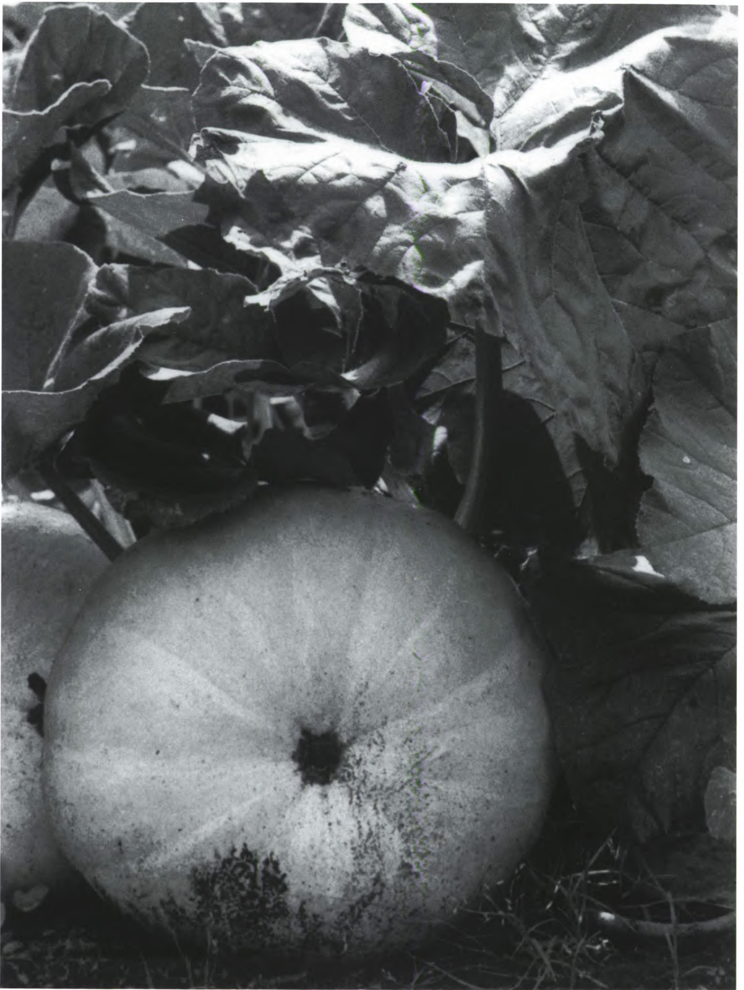
Bloeit en groei in de Moestuin.